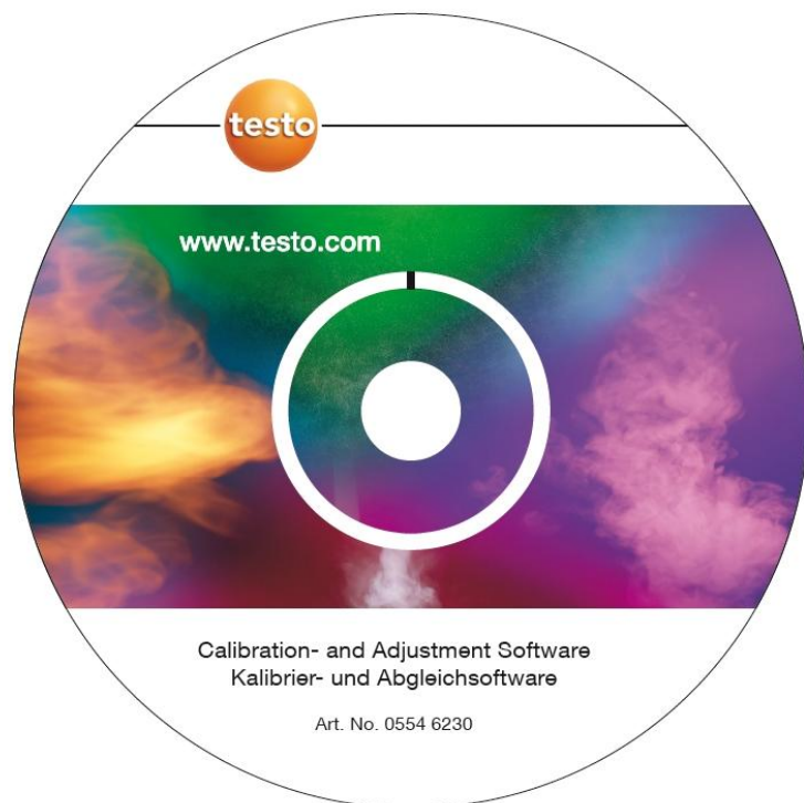
ПО для калибровки и настройки