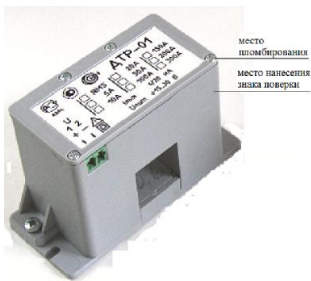
Рисунок 1 - Внешний вид преобразователя ДТР-01

Внешний вид преобразователей показан на рис. 1,2 и 3.