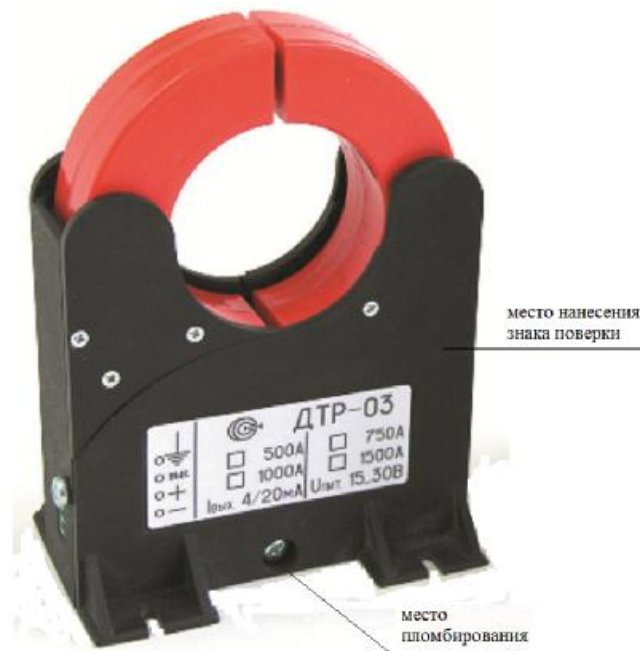
Рисунок 3 - Внешний вид преобразователей ДТР-03 Несанкционированный доступ внутрь приборов предотвращается пломбированием винта крепления передней стенки.