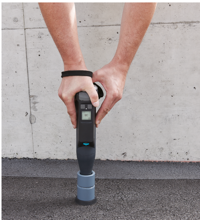
Original Schmidt Live с портативной тестовой наковальней