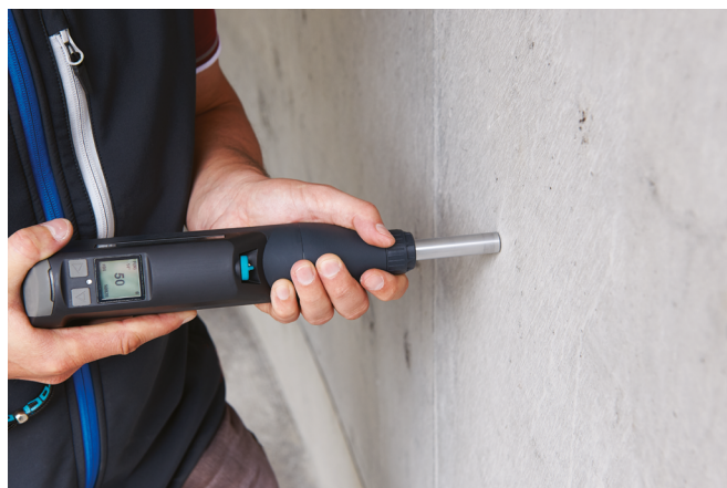
Original Schmidt Live с цифровым дисплеем