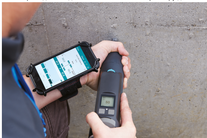
Original Schmidt Live с приложением для iOS