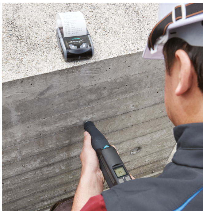
Original Schmidt Live Print с Bluetooth-принтером