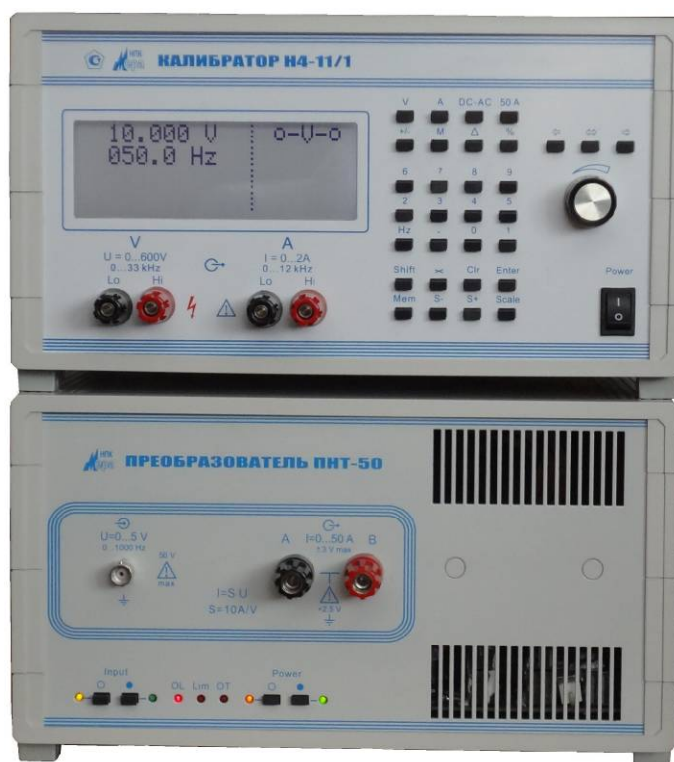
Рисунок 1 - Общий вид калибратора универсального Н4-11/1

Общий вид калибратора представлен на рисунке 1. Схема пломбировки от несанкционированного доступа, обозначение места нанесения знака поверки представлены на рисунке 2.