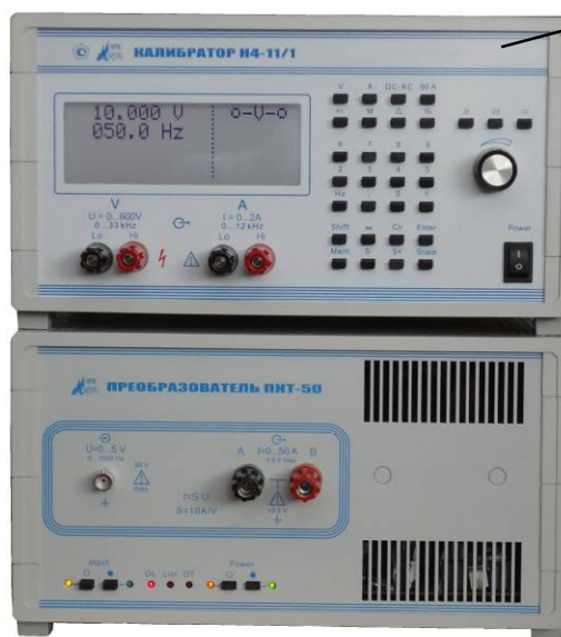
Рисунок 2 - Схема пломбировки от несанкционированного доступа, обозначение мест нанесения знаков поверки

Место нанесения знака поверки в виде наклейки