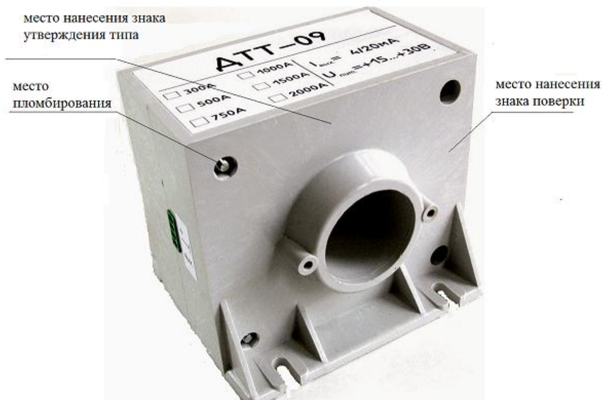
Рисунок 4 - Внешний вид модели ДТТ-08 и ДТТ-09