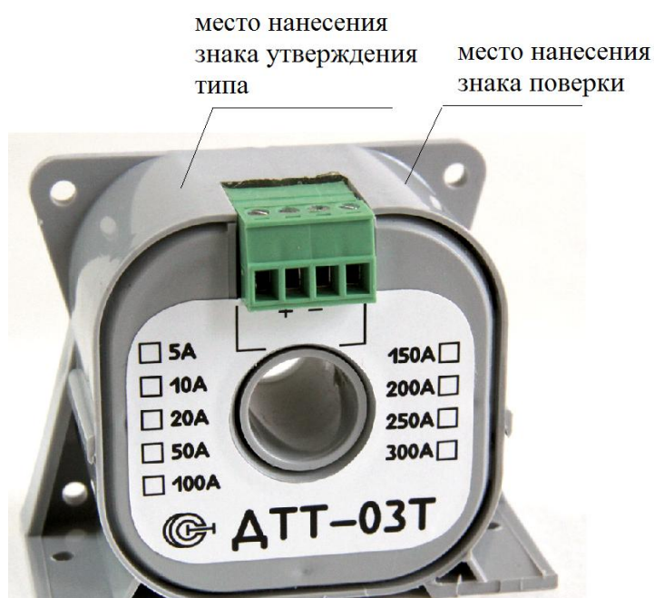
Рисунок 1 - Внешний вид модели ДТТ-03Т

Корпуса моделей ДТТ-06Н, ДТТ-07Н и ДТТ-08 и ДТТ-09 разборные. Их внешний вид с указанием мест нанесения знаков утверждения типа, поверки и пломбирования, предотвращающего несанкционированное вскрытие корпуса, показаны на рисунках 3 и 4.