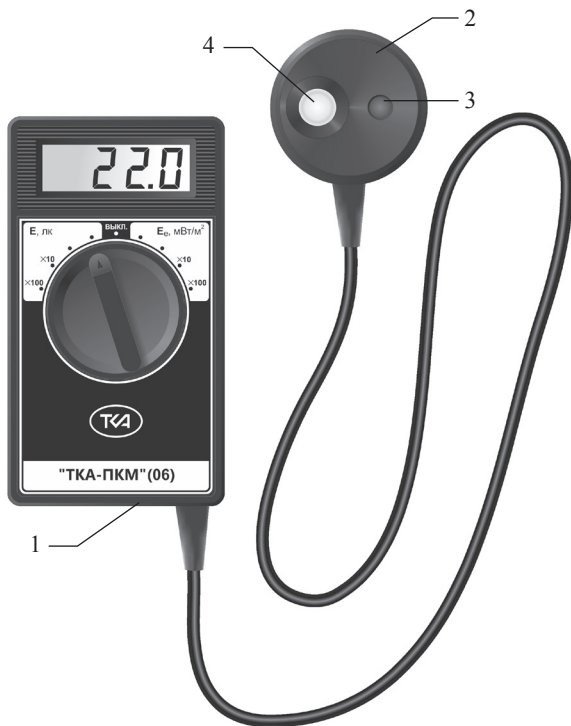
Рис.1 – Внешний вид прибора “ТКА-ПКМ”(06)