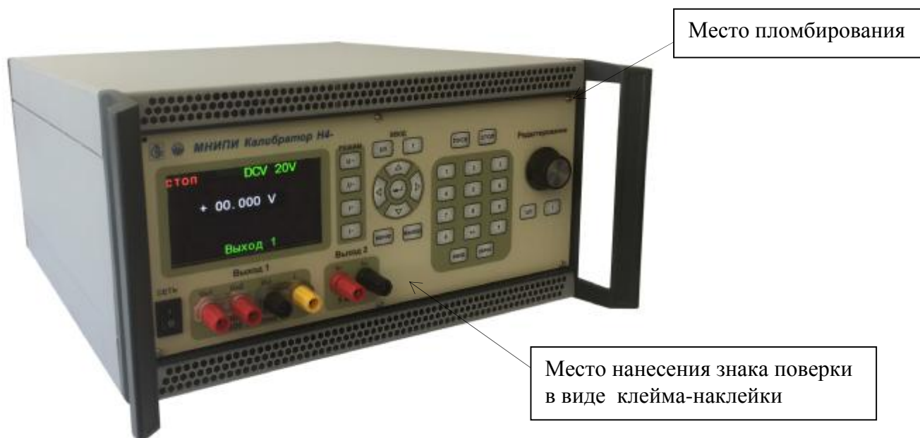
Рисунок 1 – Внешний вид калибратора Н4-301 с указанием места пломбирования и места нанесения знака поверки в виде клейма-наклейки