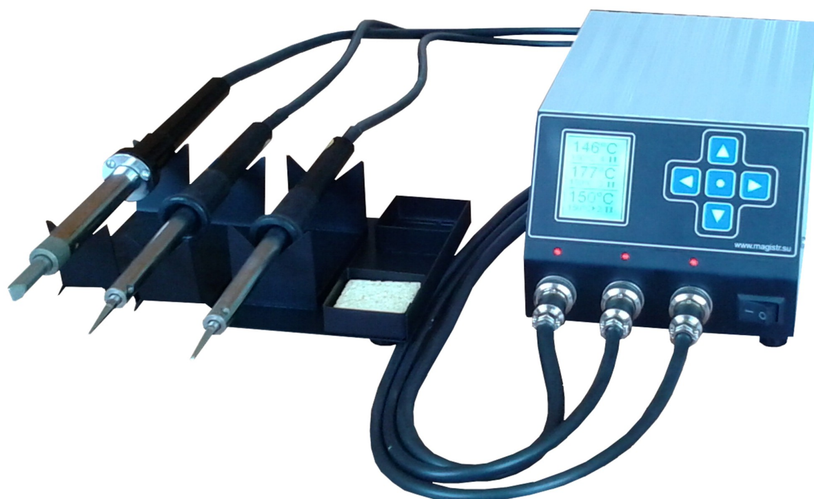
Фото 1. Общий вид станции

Паяльная станция состоит из блока управления и паяльных инструментов. Блок управления выполнен в металлическом корпусе и имеет полную гальваническую развязку от питающей сети. На передней панели блока управления расположены сетевой выключатель, разъемные соединители для подключения трех паяльных инструментов, световые индикаторы подключения инструментов, жидкокристаллический дисплей и пятикнопочная клавиатура. На задней панели блока управления находятся сетевой шнур, плавкий предохранитель (5А) и клемма для подключения заземления.