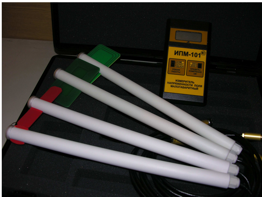
Рис.1 Общий вид измерителя напряженности поля ИМП-101