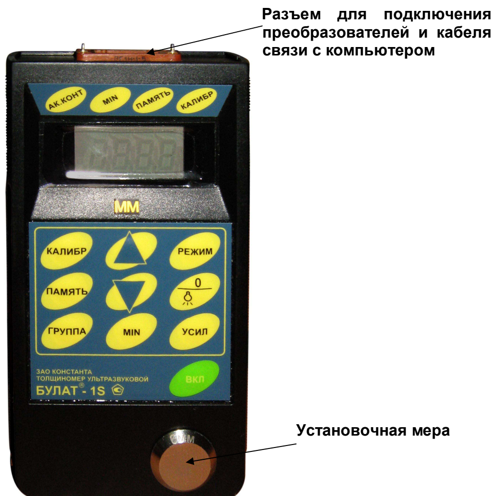
Рис.1. Булат 1S

Расположение клавиатуры и индикатора на лицевой панели блока обработки информации прибора приведено на рисунке 1.