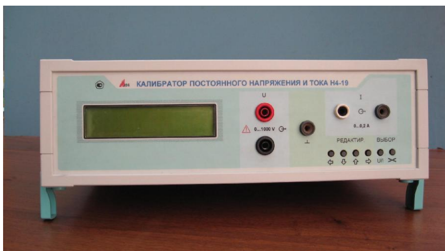
Рисунок 1 - Общий вид калибратора

Общий вид калибратора представлен на рисунке 1. Схема пломбировки от несанкционированного доступа, обозначение мест нанесения знаков поверки на рисунке 2.