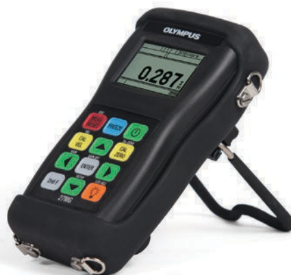
27MG с защитным резиновым чехлом (опция) и подставкой

Стандартная комплектация может варьироваться в зависимости от страны. Для получения дополнительной информации обращайтесь к региональному представителю компании.