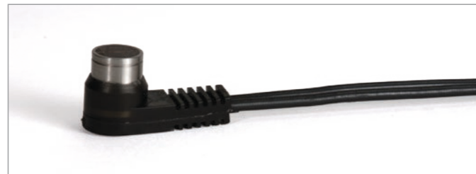
Преобразователь D7910 отличается высокой производительностью и доступной ценой.

В комплекте к толщиномеру 27MG прилагается экономичный отдельно-совмещенный преобразователь D7910, предназначенный для коррозионного мониторинга. Для измерения толщины слишком толстых или слишком тонких материалов, или труб малого диаметра, компания Olympus предлагает полный ассортимент отдельно-совмещенных ПЭП. Совместимые с 27MG, преобразователи Olympus имеют функцию автоматического распознавания; данная функция оптимизирует характеристики ПЭП, вызывая коррекцию V-пути по умолчанию.